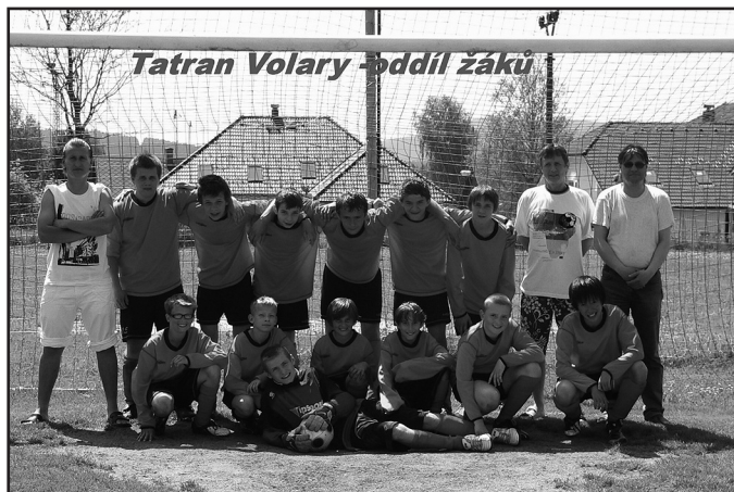
Tatran Volary - oddíl žáků